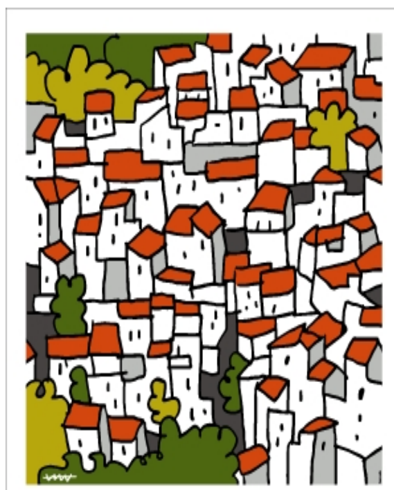
NERJA, PUEBLO BLANCO